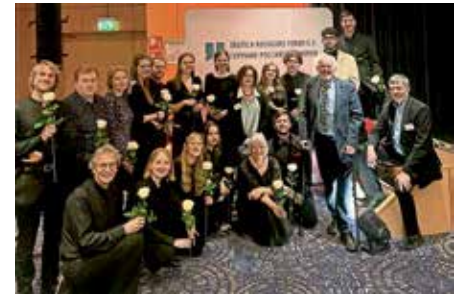
Die beiden Ensembles, PREMIER und MIR, mit Prof. Dr. Ernst Ulrich von Weizsäcker und Frau Daniela Dahn

Neue junge Teilnehmer, Interessenten und Sponsoren können sich gerne auf der Homepage www.musik-fuer-den-frieden.de melden.