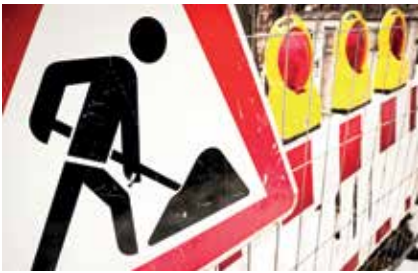
Die Stadtverwaltung Müllheim informiert: